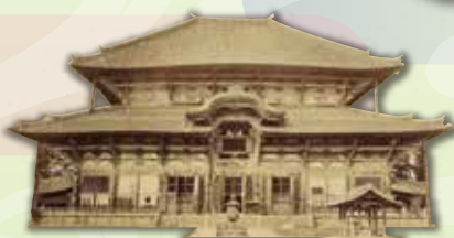
(左上)東大寺の裸仏【奈良名所八重桜】 (左下)春日野【大和名所図会】 (右上)元興寺五重塔【南都名所集】 (右下)東大寺大仏殿(明治10年代後半)