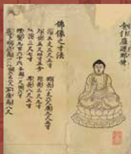
8. 東大寺大仏殿造立勸進帳