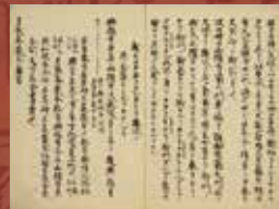
5. 建久二歳辛亥十月御巡礼記